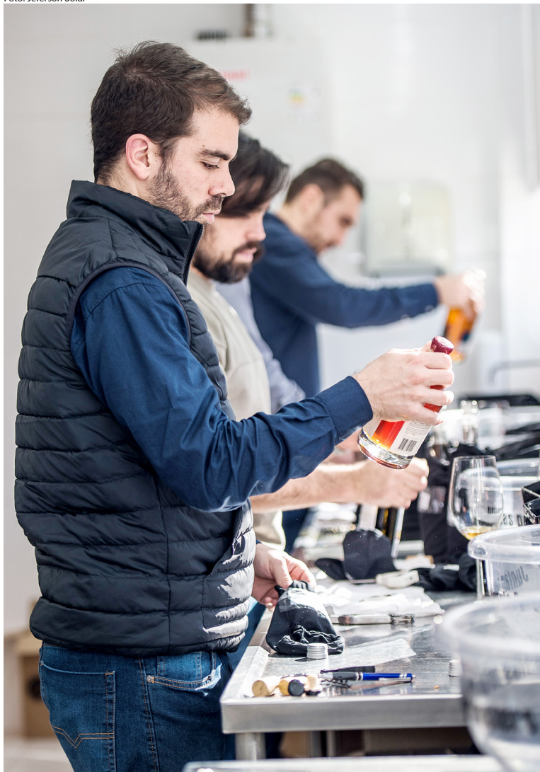
Recorde no número de amostras inscritas

Pela primeira vez em sua trajetória, o Brazil Wine Challenge ultrapassa a barreira das mil amostras, consolidando-se como um dos principais concursos internacionais de vinhos da América Latina, único com a chancela da Organização Internacional da Vinha e do Vinho (OIV), no Brasil. A ABE registra 1.034 amostras inscritas por 191 empresas. A representatividade vem de 15 países. O crescimento em relação à edição anterior, que alcançou 903 rótulos, foi de 15%.